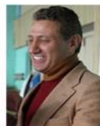
Борис Ротенберг Состояние - $1,75 млрд* Вице-президент Федерации дзюдо России