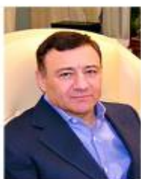
Аркадий Ротенберг Состояние - $1,75 млрд* Контролирующий акционер компании «Стройгазмонтаж» Председатель совета клуба дзюдо «Явара-Нева», борец дзюдо в одной ленинградской секции с Путиным