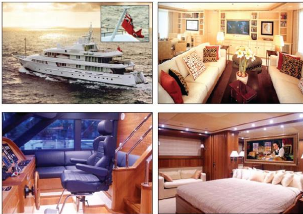
Яхты для президента // Новая газета. — №38 от 30.05. 2005 и № 39 от 02.06. 2005

джакузи, барбекю и прочие удовольствия. Обычная норма расходов на содержание такой яхты — 10% ее стоимости в год, то есть 120 млн руб. (что эквивалентно средней годовой пенсии 1400 российских пенсионеров).