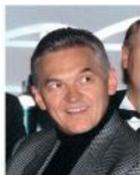
Геннадий Тимченко Состояние - $8,9 млрд* Председатель совета директоров Gupvor Group Соучредитель клуба дзюдо «Явара-Нева»